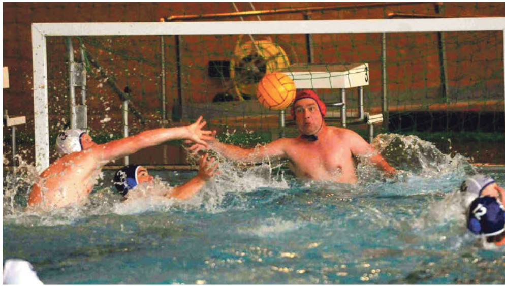
Viele Wasserballer des Winsener Schwimmvereins waren Wegbereiter für die Städtepartnerschaft mit Pont de Claix in Frankreich.

Was macht das Besondere des Winsener Schwimmvereins aus? Im Gegensatz zu den traditionellen Sportvereinen, die mehrere Sparten anbieten, konzentriert er sich ausschließlich auf den Wassersport. Inzwischen gibt es vom Babyschwimmen über den Schwimmunterricht und Leistungssport bis hin zum Wasserballsport auch im Schwimmverein diverse Möglichkeiten, sich zu betätigen. Das mag in Zeiten der Corona-Krise wie Hohn klingen, doch bietet der Schwimmverein trotz Schließung der Insel weiterhin Trainingsmöglichkeiten an. Im Sommer ist unter Einhaltung der Abstands- und Hygienemaßnahmen das Schwimmen im Freibad Stelle möglich, die Schwimmer und Wasserballer machen derzeit Gymnastik als Zoomkonferenz. Ganz Harte sollen